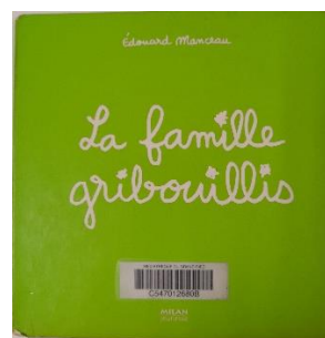
Livre « La famille gribouillis »