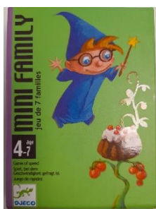
Jeu « Mini Family » à partir de 4 ans