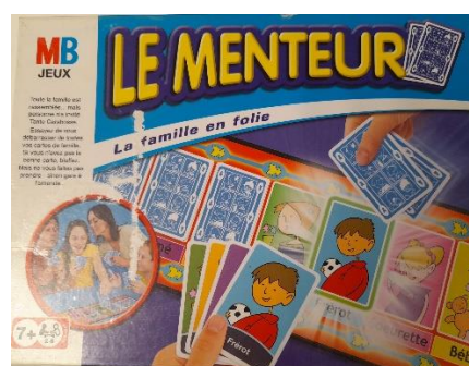
Jeu « Le menteur » à partir de 7 ans