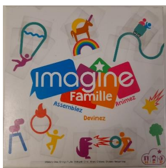
Jeu « Imagine » à partir de 8 ans

Un inventaire est disponible à l'intérieur du sac. Merci de vérifier et de laver le contenu avant de le ramener pour le plus grand bonheur de tous.